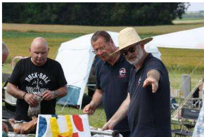
Les courageux à la corvée de patates