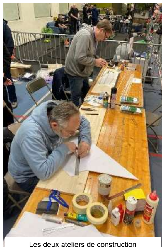
Les deux ateliers de construction Balsa et Dépron Cela à été très apprécié par les visiteurs