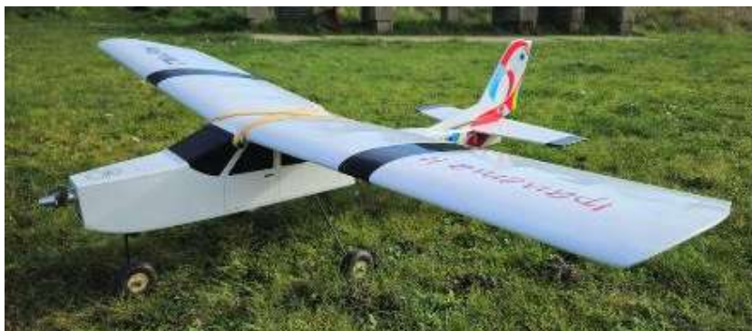
Les deux avions école du CMCP électrique pour l'Ipanéma ou thermique pour le Calmato