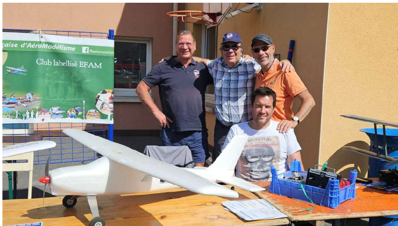
Les ambassadeurs du CMCP lors de cette journée, merci les copains !

En tout cas nous avons passé une bonne journée avec les copains et reçu un accueil chaleureux de la municipalité.