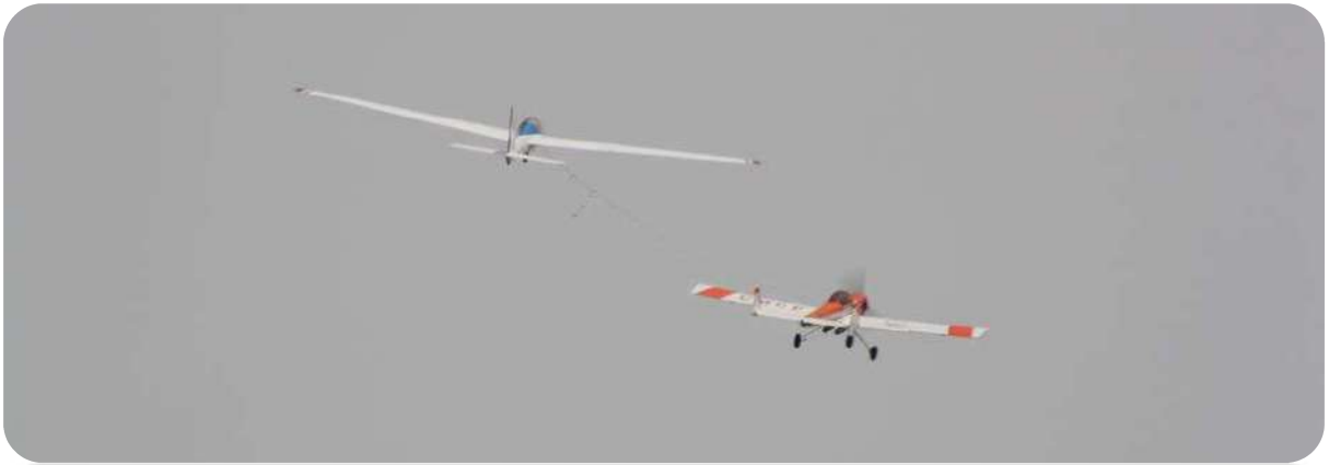
Le Fox en pleine ascension pour une séance de voltige