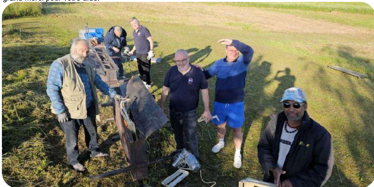
Une partie de l'équipe présente tôt le matin pour installer tout le matériel et démarrer les barbecues

Beaucoup de bonnes volontés en fin d'après-midi pour tout remballer et cela a été bien appréciable, un grand merci pour votre aide.