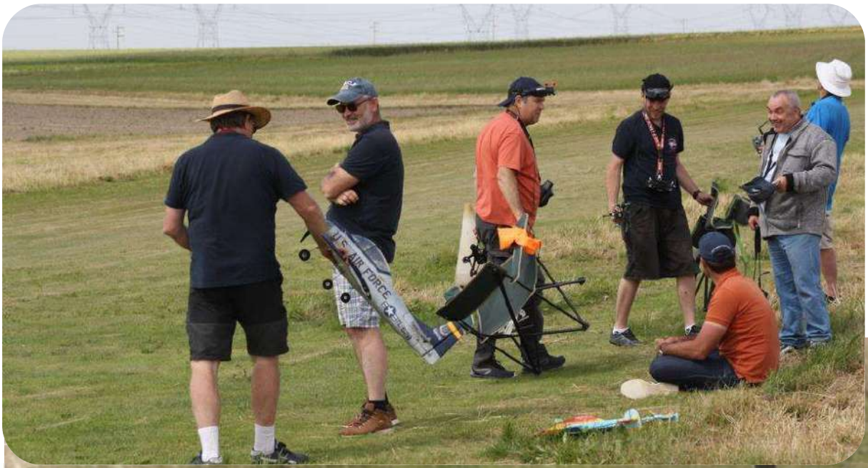
Les concurrents se préparent pour les épreuves, avions ou quadri même combat il faut être le plus adroit possible et avoir du sang froid pour tirer son épingle du jeu, le tout dans la bonne humeur bien sur...