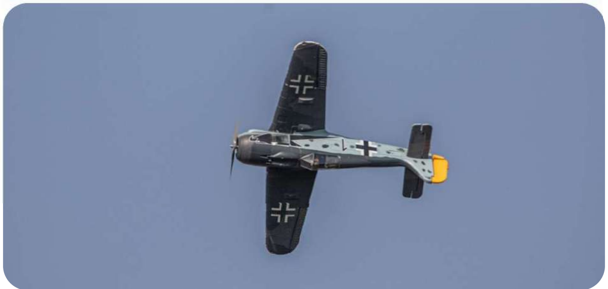
Le Focke-Wulf 190 de Jean-Claude