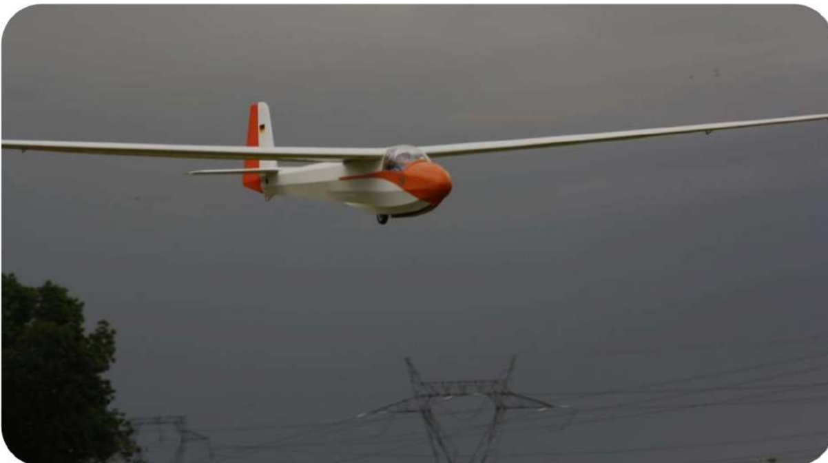
Le K6 de Alain en approche finale pour son premier vol. Il est temps de rentrer le ciel est de plus en plus menaçant...