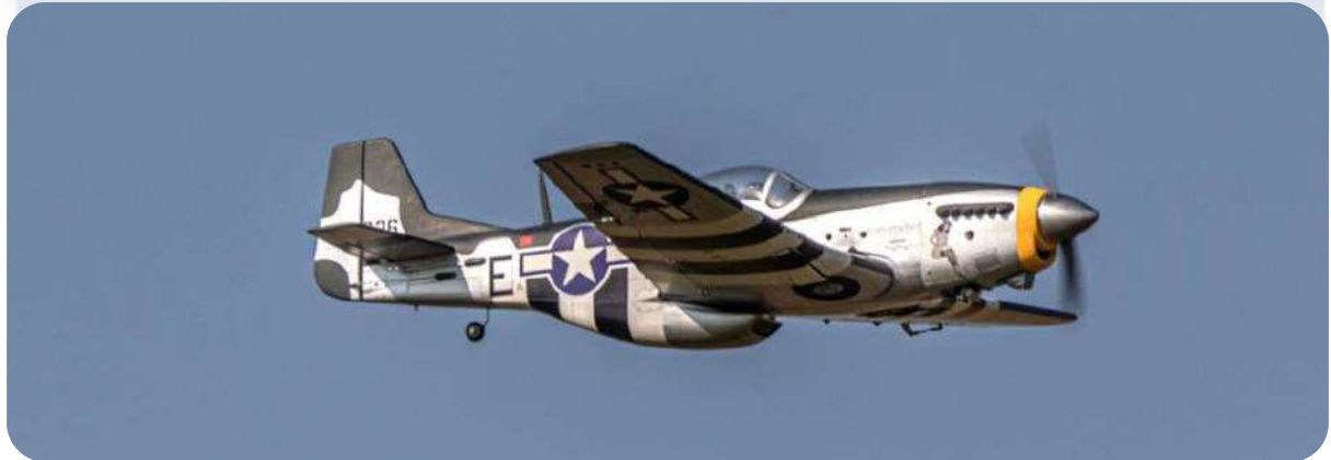
Le corsair F4U de Christophe