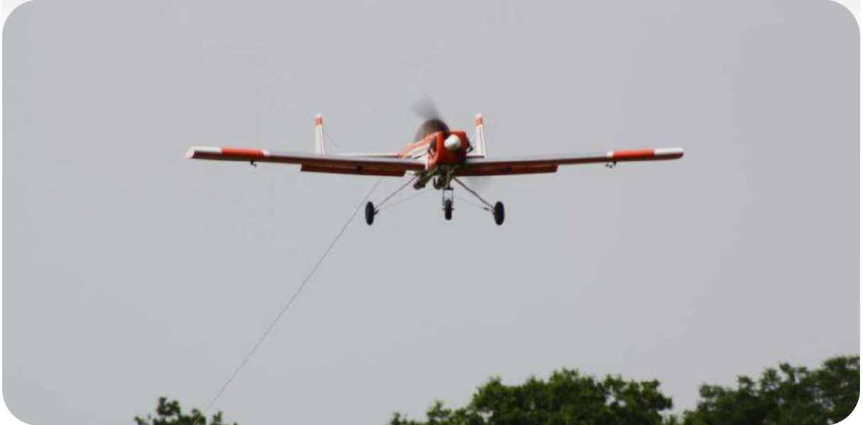
Retour de mission volets sortis pour le Bidule 111, prêt à remorquer le planeur suivant