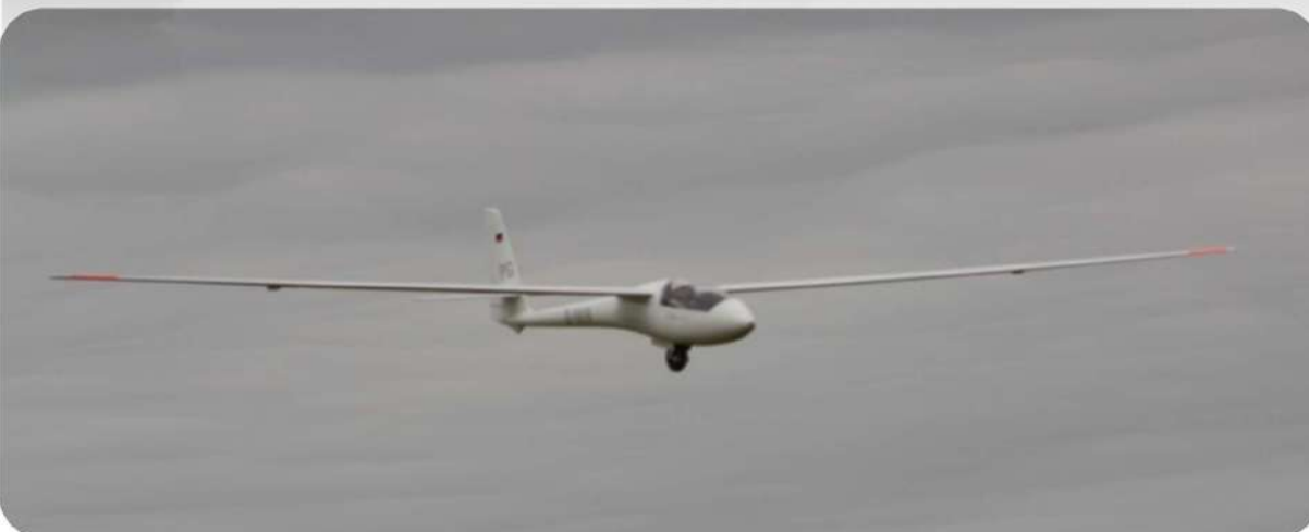
L' ASW 15 de Remi en finale ailes bien à plat, c'est beau...