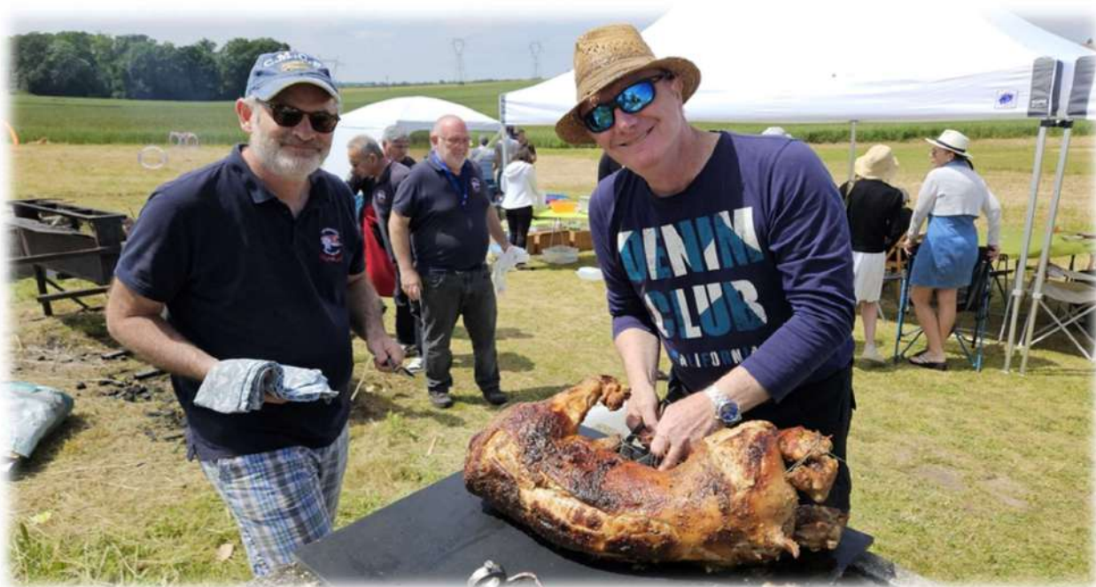
Poste stratégique la découpe, il faut faire vite et bien heureusement nous avons des spécialistes