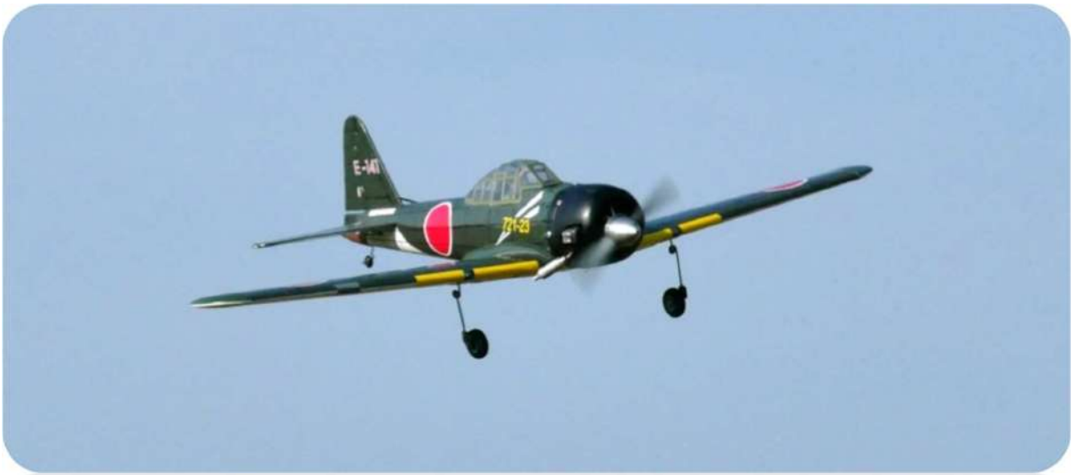
Le Zéro de Christian