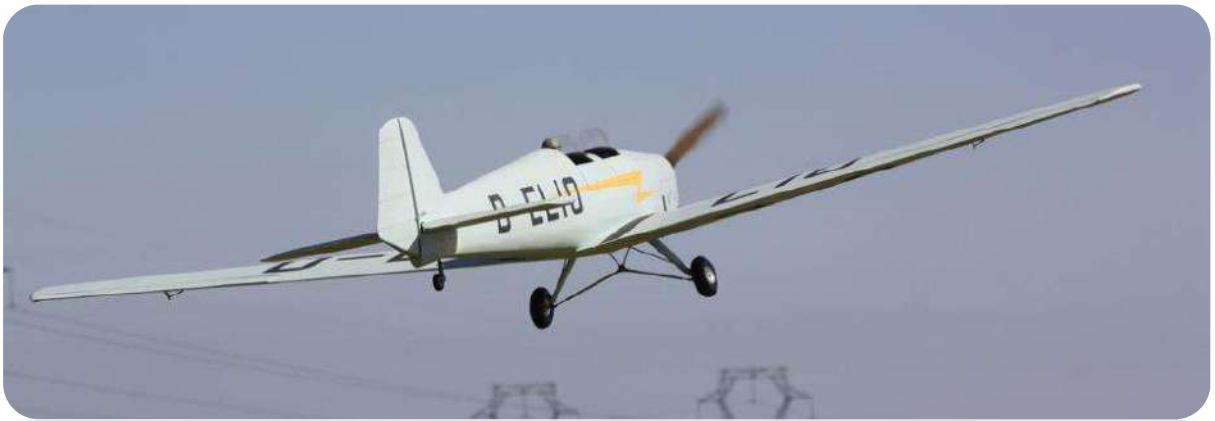
La fête du club c'est aussi l'occasion de voir de belles machines, ici le superbe Bucker Student de l'ami Marc de Pompignan