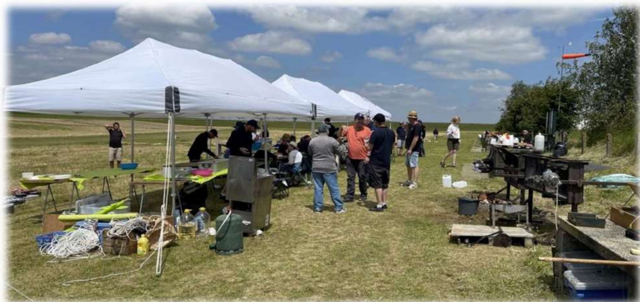
Une bien belle installation pour manger à l'abri