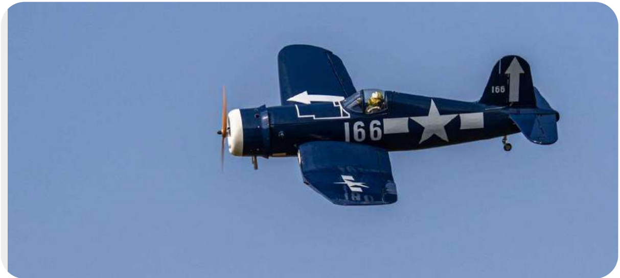
Le corsair F4U de Stéphane

Pas de grosses nouveautés cette année mais de beaux vols et une bonne ambiance.