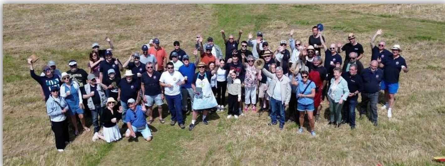
La photo de famille 2024, que de bons moments !