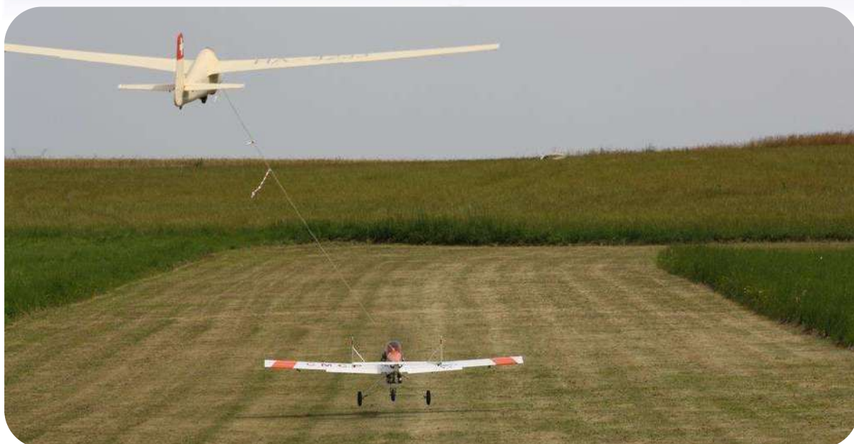
Le MUCHA de Marc en plein décollage, remarquez la position parfaite de l'ensemble, le planeur et le remorqueur ont les ailes bien à plats, le planeur est bien au-dessus du remorqueur et la remorque est parfaitement tendue, un cas d'école