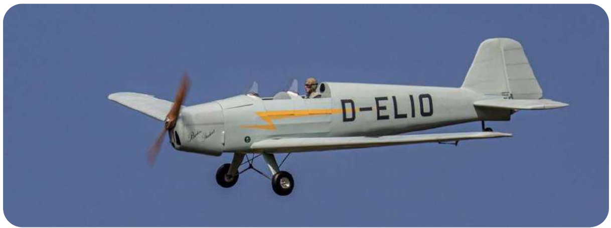
Le Bucker Student de Marc