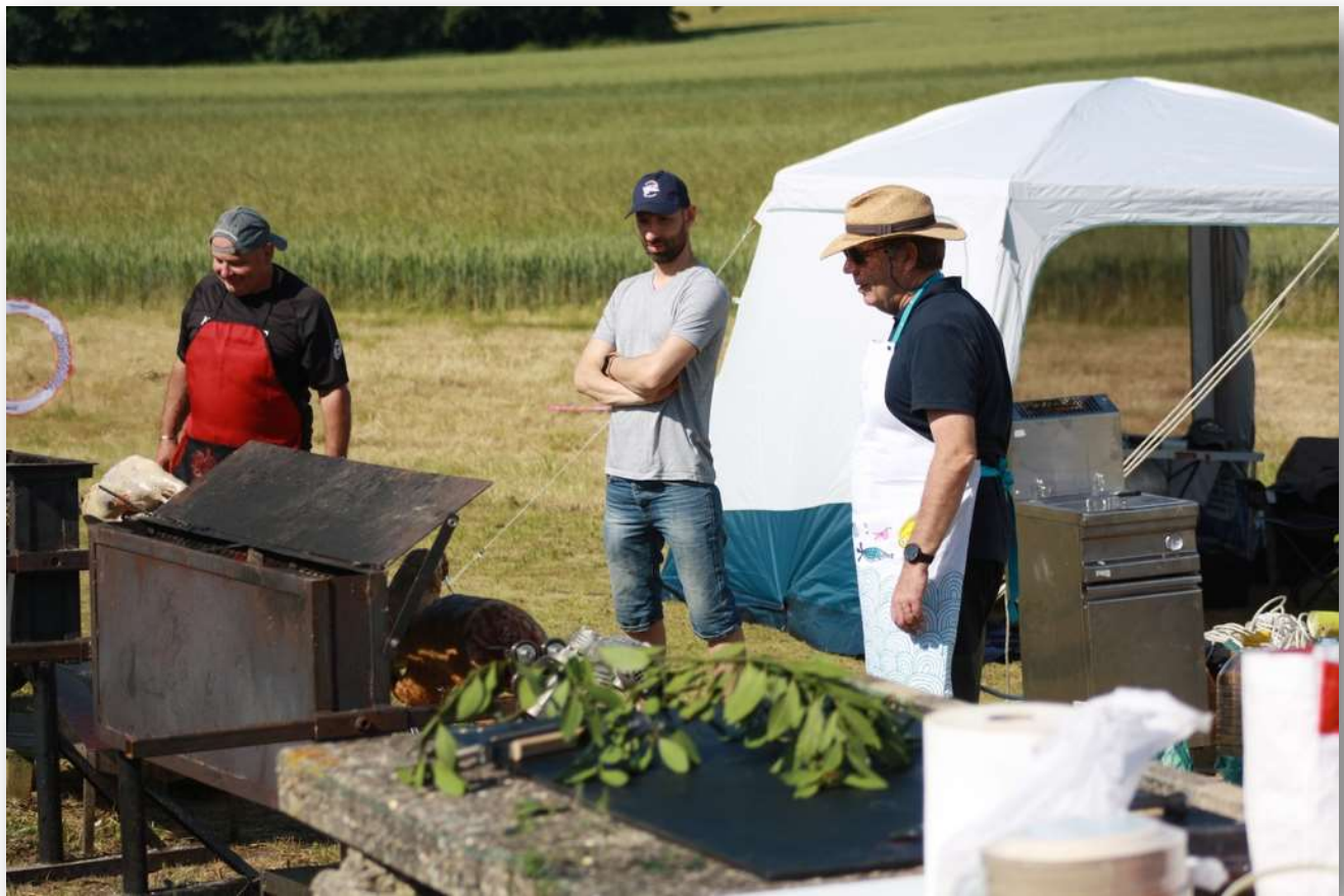
Les rôtisseurs en pleine action