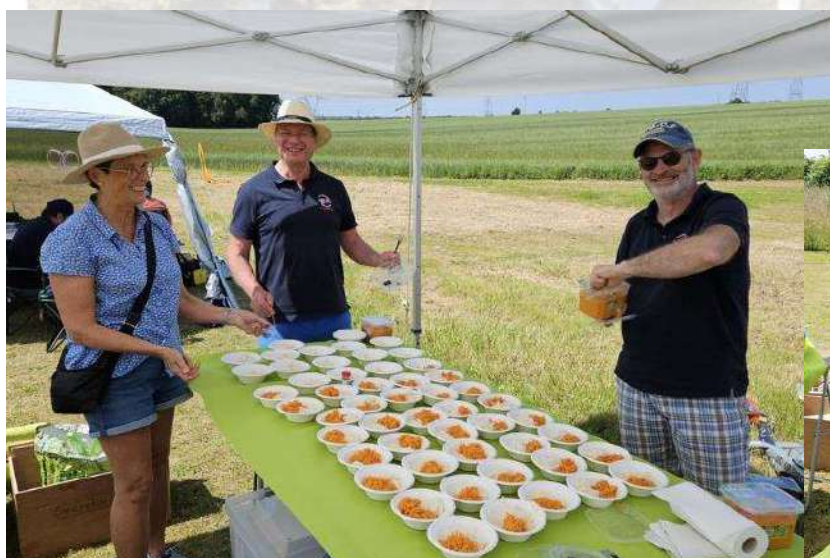
Pendant que les rôtisseurs sont à la cuisson notre équipe de choc s'occupe des entrées. Avec le sourire bien sûr !