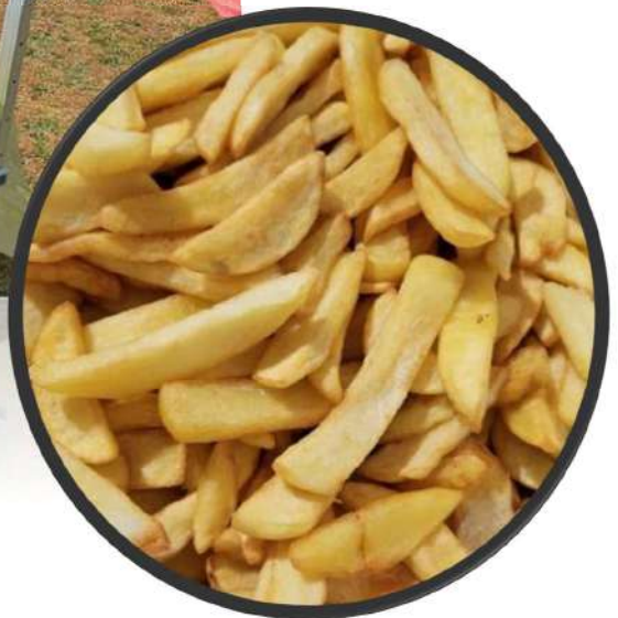
Rien de tel que des frites pour accompagner les grillades et donner un bon air de fête