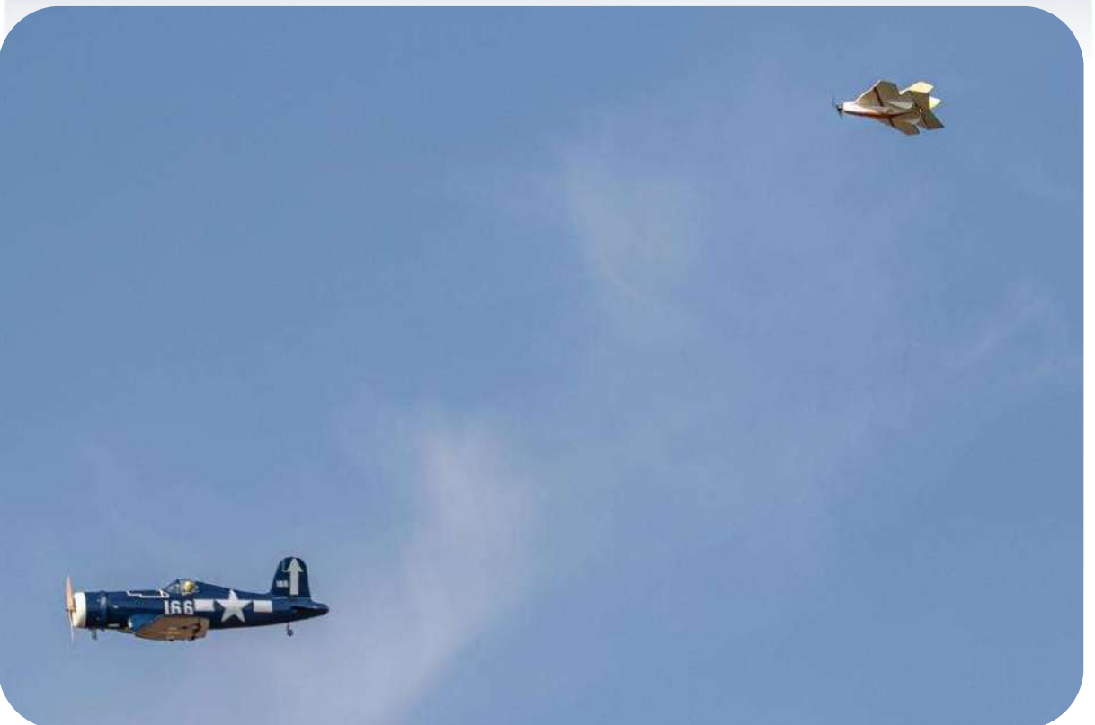
Corsair F4U VS Karaté...