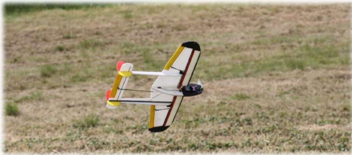
Un Funder à l'attaque des pauvres baguettes...