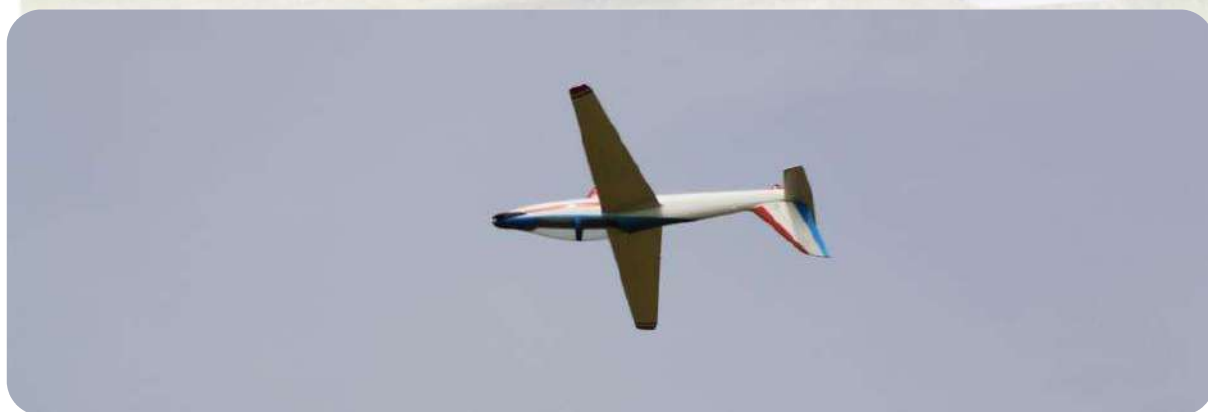
Christophe dans ses œuvres avec son magnifique FOX, magique...