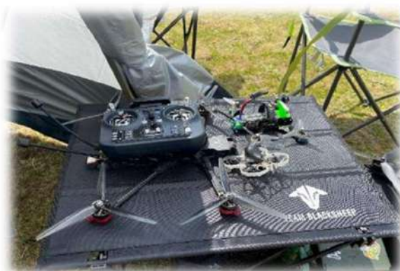
Là c'est de la high tech, tout est prévu dans les moindres détails