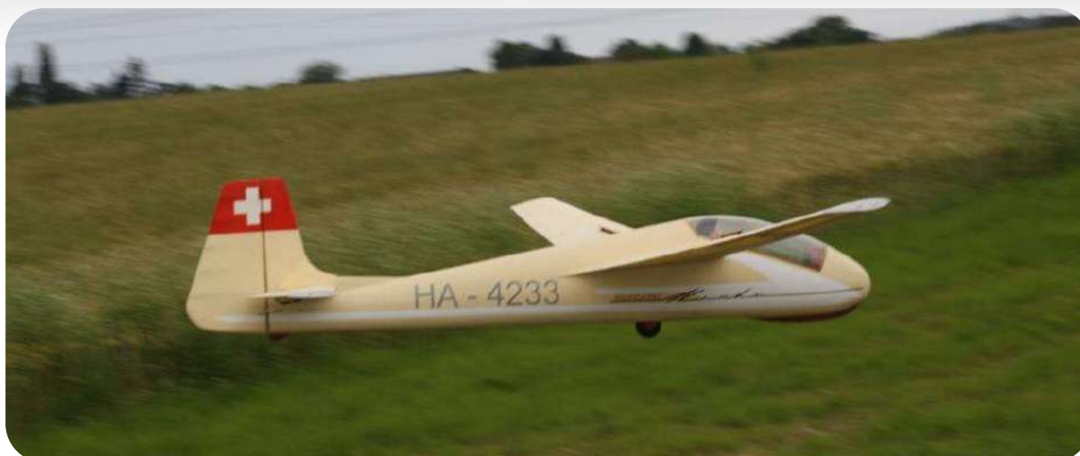
Le Mucha de Marc, une construction très soignée et des vols d'un réalisme saisissant