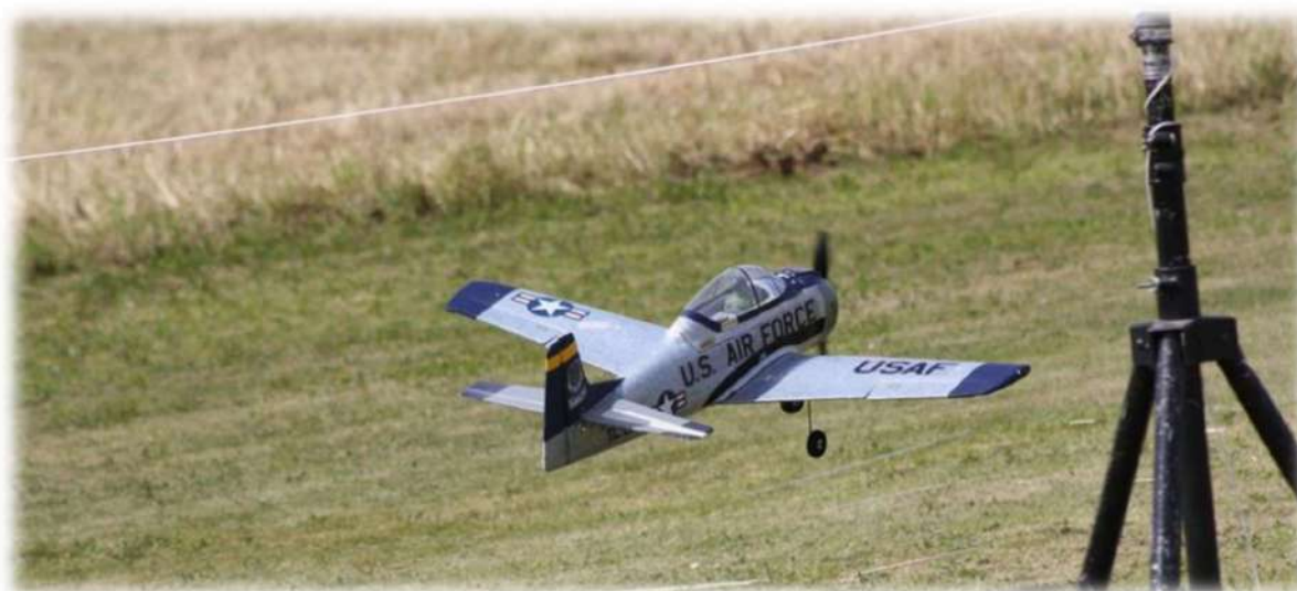
Autre jeu d'adresse le passage sous limbo, ici ce bon vieux T28, ça passe à l'aise...