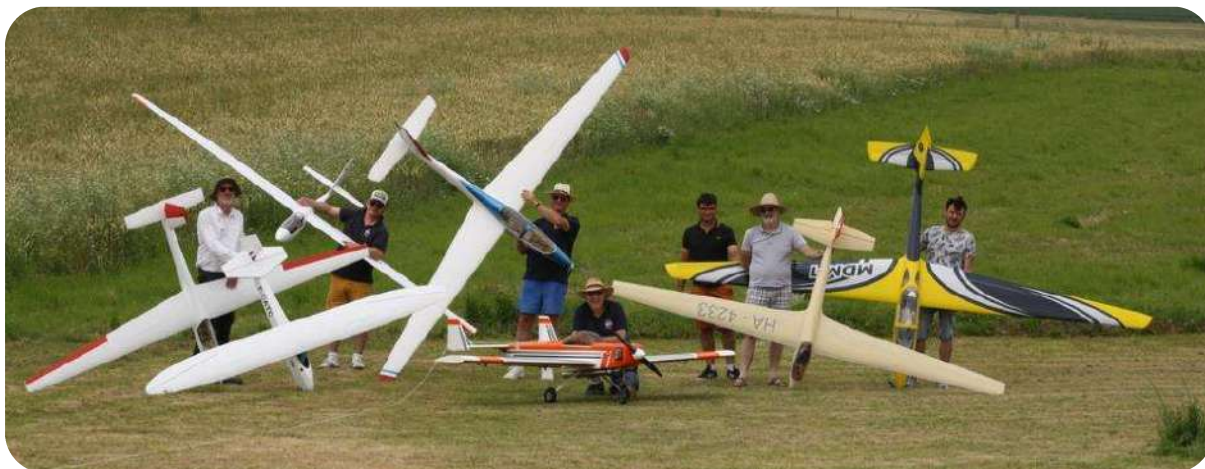
La photo de famille, il y avait de bien beaux planeurs et de belles nouveautés