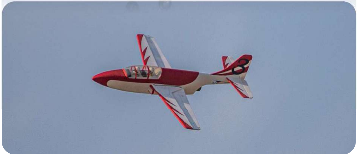
Le Iskra de Fifi